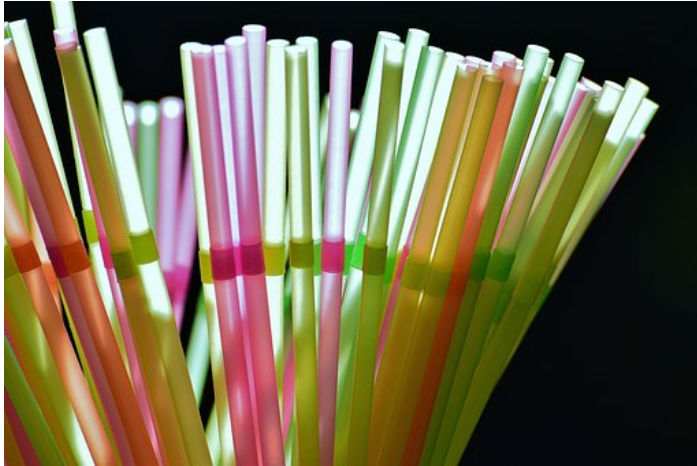
Über im Flüssig

Kurzum: Ideen werden gesammelt und umgesetzt, möglichst jeden Plastikmüll im Nachtleben zu meiden. Back to Stroh-Halm im wahrsten Sinne. Die Trinkröhren gibt es übrigens mittlerweile auch edel aus Glas – aber unpraktisch und teuer im Club-Alltag. Ein Tipp an die Clubs war so aber auch: Halme für Drinks überhaupt erst auf Nachfrage rauszugeben.