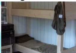
Zeugnis der Verbrechen