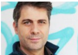
Die drei in der Sommerresidenz