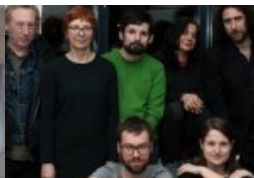
Neue Literaturzeitschrift „Tau“