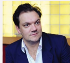
Regisseur Charly Hübner