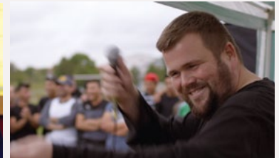
Jan „Monchi“ Gorkow